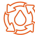
Acque, Depurazione e Scarichi