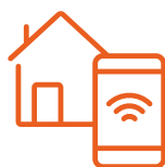
Smart Building Domotica