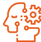
Laboratori di Ricerca e Aziende Ingegneristiche