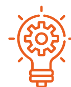
Settore Energie / Energie Rinnovabili