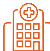
Hospital & Sanità