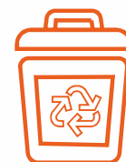
Settore Discariche / Gestione Rifiuti