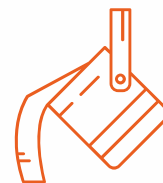
Fonderie / Acciaierie