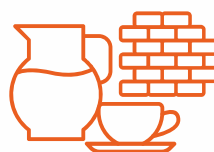
Ceramica, Piastrelle , Laterizi