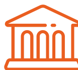
Settore Museale e Beni Culturali