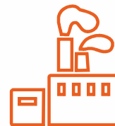
Industria Chimica - Petrochimica / Plastica